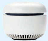
© Caru Das eingesetzte Gerät kann von der Abbildung abweichen!

Dieses Paket wird durch Ihre Pflegekasse unterstützt. Gerne beraten wir Sie und helfen bei der Antragstellung für die Kostenübernahme bei gesetzlich Versicherten.